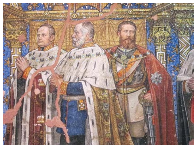
Abb. 24: Mosaikdarstellung der drei preußischen Könige in der Kaiser-Wilhelm-Gedächtniskirche: Friedrich Wilhelm IV., Wilhelm I. und dessen Sohn Friedrich III., der wegen seiner schweren Erkrankung nur 99 Tage herrschen sollte.

Verdient Wilhelm I. den Beinamen “der Große”, den ihm sein Enkel Wilhelm II. verleihen wollte? Das wird jeder – je nach seiner politische Ausrichtung – anders beantworten. Der erste Deutsche Kaiser, dessen Sammlung Künker die Ehre hat zu versteigern, war auf jeden Fall ein Mann, der seine Zeit und sein Land geprägt hat. Und dessen Handlungen sogar bis ins ferne Japan Auswirkungen zeigten.