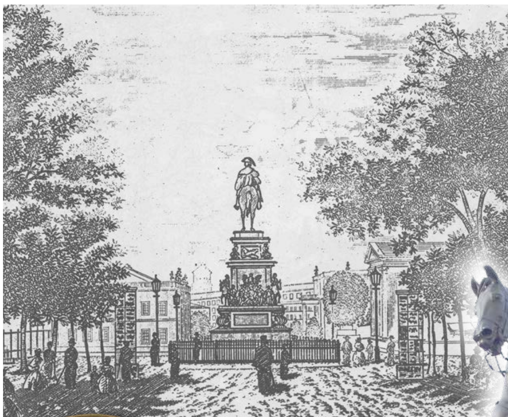
Abb. 18a: Illustration aus dem Bericht von Kume Kunitakes über die Iwakura-Mission. Deutlich zu erkennen ist hier das Denkmal für Friedrich II. von Preußen.