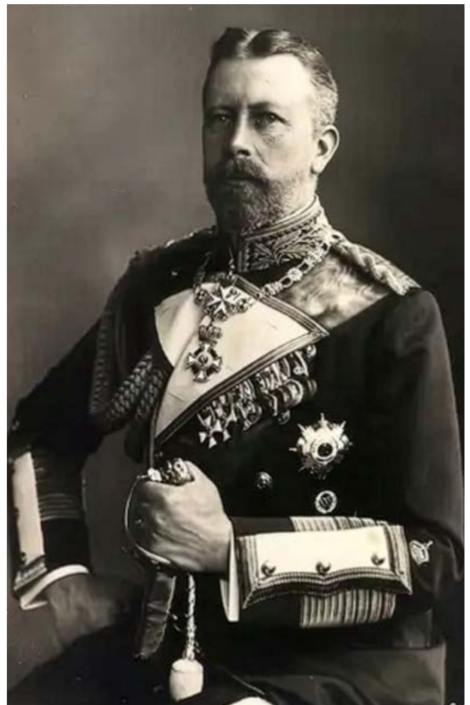
Abb. 6: Prinz Heinrich von Preußen, Groß-Admiral der deutschen Flotte, Photographie-Postkarte von ca. 1911. Privatbesitz