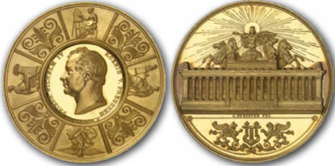
Abb. 6: Große Preismedaille der Akademie für Kunst. Sie wurde den Künstlern verliehen, die im Rahmen der jährlichen großen Kunstausstellung das beste Kunstwerk abgeliefert hatten.

Der Staat tat das Seine, um den Fortschritt zu fördern. Natürlich gehörte die Veranstaltung von Gewerbeausstellungen dazu. Aber auch die Grundlagenforschung spielte eine zentrale Rolle. Von größter Bedeutung war dabei die Königlich-Preußische Akademie der Wissenschaften. Sie finanzierte Forscher, diente als Diskussionsplattform, zeichnete wissenschaftliche Leistungen aus und machte sie publik. Preismedaillen waren ein zentrales Element der Förderung.