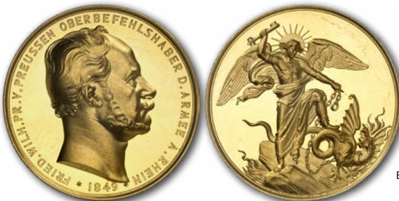
Abb. 8: Die konservativen Kräfte feierten Wilhelm I. im Jahr 1849 für die militärische Bekämpfung der revolutionären Bewegungen. Die liberalen und demokratischen Kreise sahen sein Engagement natürlich anders. Auf dieser sehr seltenen Medaille ist Wilhelm auf der Vorderseite als Befehlshaber der Rheinarmee angesprochen, auf der Rückseite als der Erzengel Michael darstellt, der den Drachen der Revolution tötet.

Die Hohenzollern waren direkte und persönliche Förderer Alexander von Humboldts. Er war ein regelmäßiger Gast an der königlichen Tafel. Man erwartete von ihm, dass er abends der Hofgesellschaft vorlas und im Schloss Vorträge hielt.