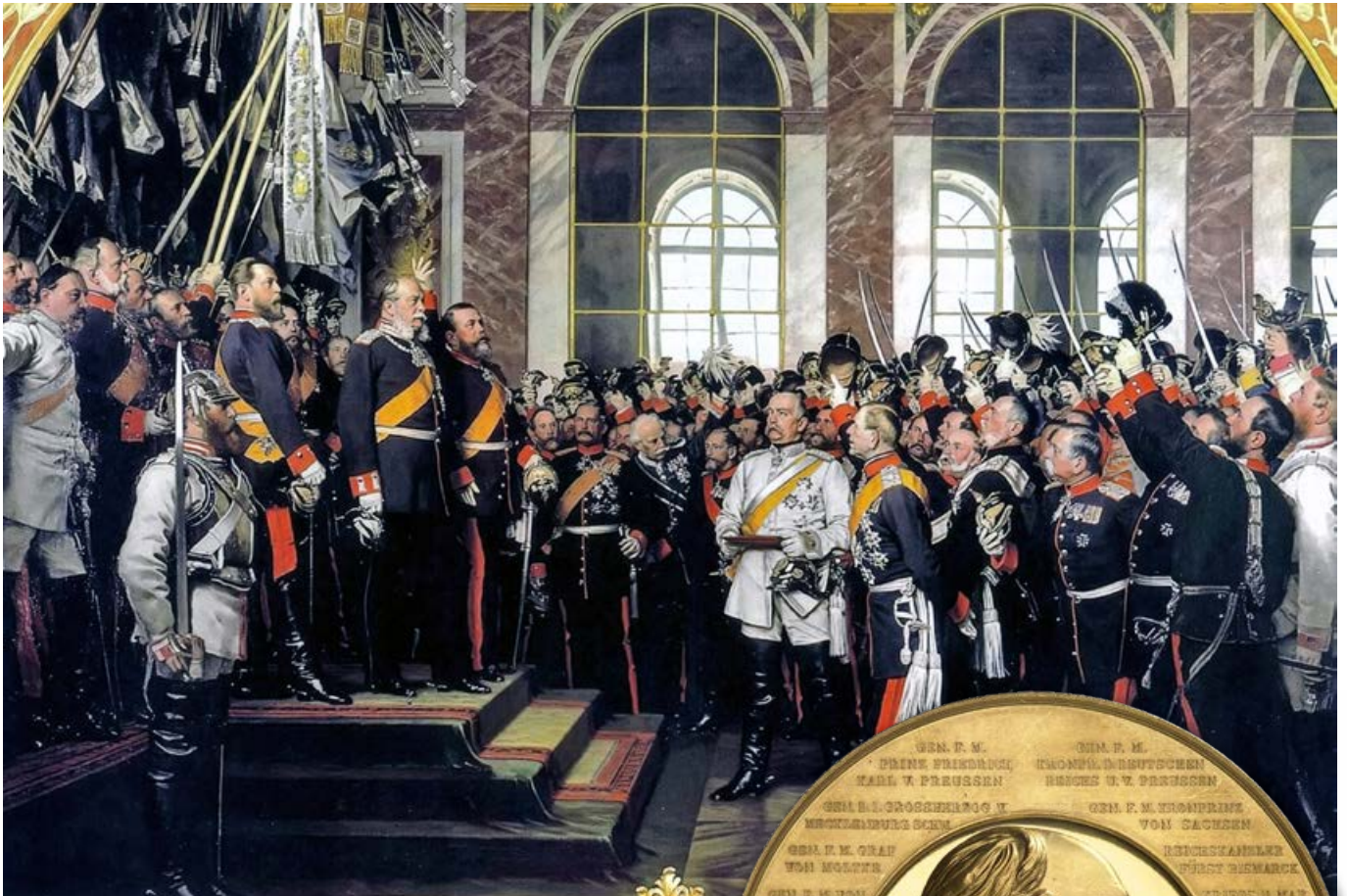
Abb. 15: Kaiserproklamation im Spiegelsaal von Versailles. Ölgemälde aus dem Jahr 1885 von Anton von Werner.

Deutschen Kaiserreich zu vereinigen. Am 18. Januar 1871 wurde Wilhelm I. im Spiegelsaal des Schlosses zu Versailles zum deutschen Kaiser ausgerufen. Ein ikonischer Moment, der weder in Deutschland noch in Frankreich vergessen wurde. Nicht umsonst bestand die französische Regierung darauf, den Frieden von Versailles, der die totale Niederlage Deutschlands im Ersten Weltkrieg besiegelte, an gleicher Stelle zu schließen.