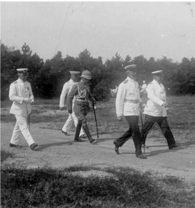
Abb. 8: Prinz Heinrich mit Gefolge 1912 in Japan, Photographie von 1912.