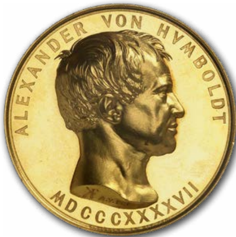
Abb. 7: Humboldt-Medaille von 1847. Der preußische König Friedrich Wilhelm IV. stiftete persönlich eine Medaille, um die Publikation des 2. Bandes von Alexander von Humboldts "Kosmos" zu feiern. Wahrscheinlich handelt es sich bei diesem Stück um das Exemplar, das sich der König selbst vorbehielt oder das er seinem ebenfalls sammelnden Bruder Wilhelm I. schenkte.

Abb. 6 weist auf einen neuen Aspekt der kulturellen Bildung hin. Volksschulen und Schulpflicht gab es in Preußen bereits seit dem Beginn des 18. Jahrhunderts. Doch im 19. Jahrhundert intensivierte man die Erwachsenenbildung durch Kunst in Museen. Die Preismedaille der Akademie für Kunst zeigt eine Frontalansicht des Alten Museum im Lustgarten, wo der preußische König das ausstellte, was man damals als „hohe Kunst“ empfand: Gemälde und Statuen sowie archäologische Objekte der griechischen und römischen Kultur. Sie zu betrachten, sollte das ästhetische Empfinden des Publikums schulen.