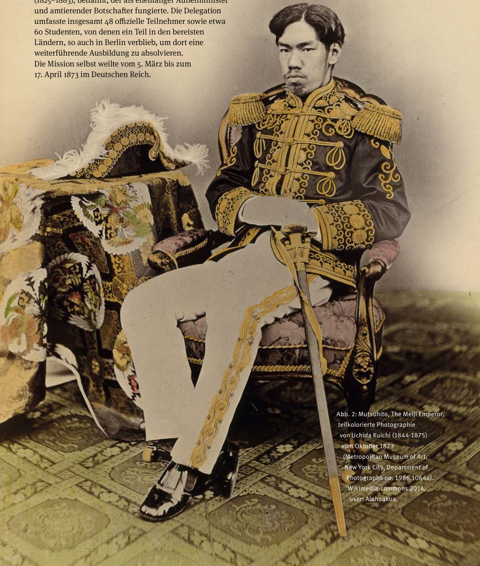
Abb. 2: Mutsuhito, The Meiji Emperor, teilkolorierte Photographie von Uchida Kuichī (1844-1875) vom Oktober 1873 (Metropolitan Museum of Art, New York City, Department of Photographs no. 1986.1064a).

Im August 1872 entsandte der Meiji-Tennō die sogenannte Iwakura-Mission [岩倉使節団] in westliche Staaten. Sie war nach ihrem Leiter, Fürst Iwakura Tomomi [岩倉 具視] (1825–1883), benannt, der als ehemaliger Außenminister und amtierender Botschafter fungierte. Die Delegation umfasste insgesamt 48 offizielle Teilnehmer sowie etwa 60 Studenten, von denen ein Teil in den bereisten Ländern, so auch in Berlin verblieb, um dort eine weiterführende Ausbildung zu absolvieren. Die Mission selbst weilte vom 5. März bis zum 17. April 1873 im Deutschen Reich.