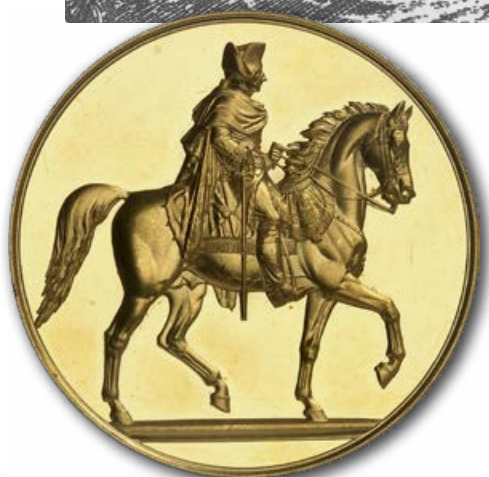
Abb. 18b: Rückseite der preußischen Medaille auf die Denkmalsenthüllung im Jahr 1851.