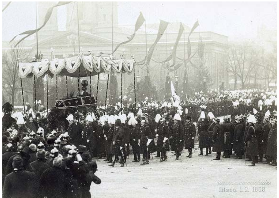
Abb. 23: Trauerzug für Wilhelm I.