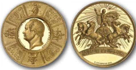
Abb. 5: Preismedaille für die Wissenschaft

Der Staat tat das Seine, um den Fortschritt zu fördern. Natürlich gehörte die Veranstaltung von Gewerbeausstellungen dazu. Aber auch die Grundlagenforschung spielte eine zentrale Rolle. Von größter Bedeutung war dabei die Königlich-Preußische Akademie der Wissenschaften. Sie finanzierte Forscher, diente als Diskussionsplattform, zeichnete wissenschaftliche Leistungen aus und machte sie publik. Preismedaillen waren ein zentrales Element der Förderung.