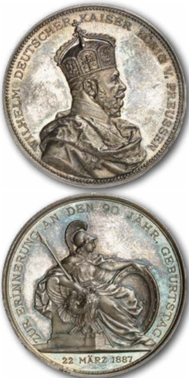
Abb. 22: Medaille anlässlich des 90. Geburtstags des Kaisers im Jahr 1887.