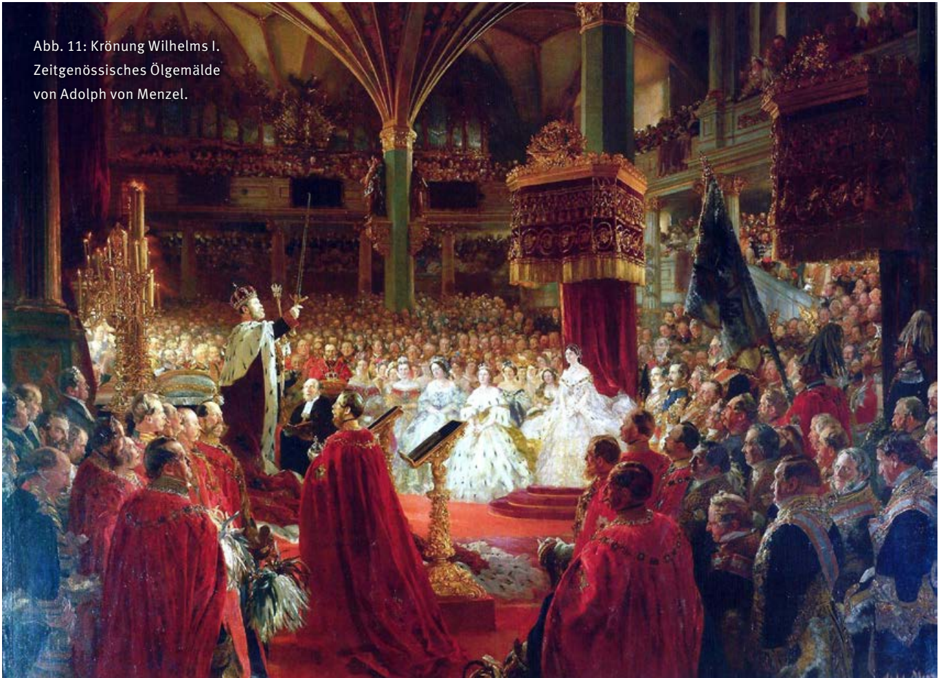
Abb. 11: Krönung Wilhelms I. Zeitgenössisches Ölgemälde von Adolph von Menzel.

Viele Statuen, die in diesen Jahren errichtet wurden, sind mittlerweile aus dem Stadtbild verschwunden. Aber Medaillen halten fest, welche Rolle ihnen in der königlichen Politik zukam: Die Statuen bedeutender Generäle sollten zum Vorbild für jeden Passanten werden. Eine Frühform der Öffentlichkeitsarbeit sozusagen.