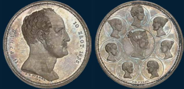
Kaiserreich Russland Nikolaus I., 1825-1855. 1 ½ Rubel (10 Zlotych) 1835, St. Petersburg. Familienrubel. Von größter Seltenheit. Nur 36 Exemplare geprägt. Kabinettstück. Prachtvolle Patina, fast Stempelglanz.