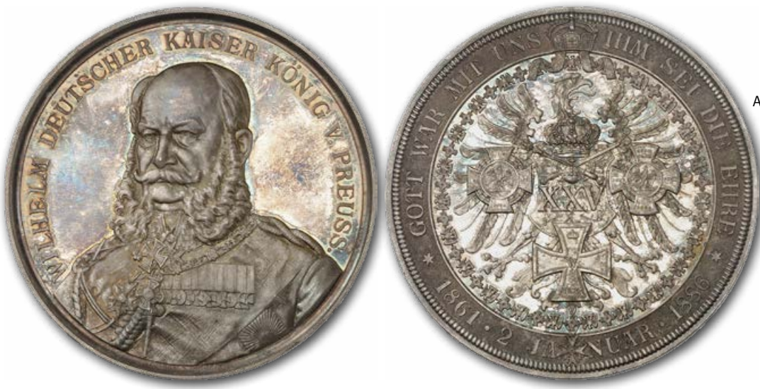
Abb. 21: Medaille anlässlich Wilhelms Thronjubiläum im Jahr 1886.