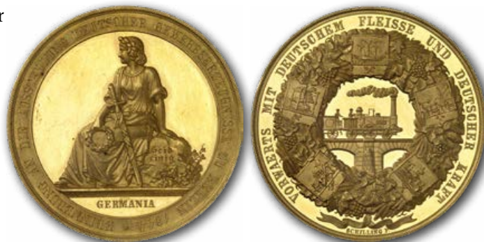
Abb. 4: Offizielle Medaille der Ausstellung deutscher Gewerbezeugnisse in Berlin im Jahr 1844. Auf der Rückseite sind die wichtigsten Treiber der Industrialisierung abgebildet. Ausstellungen wie diese wurden in vielen Ländern unter königlicher Schutzherrschaft durchgeführt, um den Austausch und die Industrialisierung zu beschleunigen.