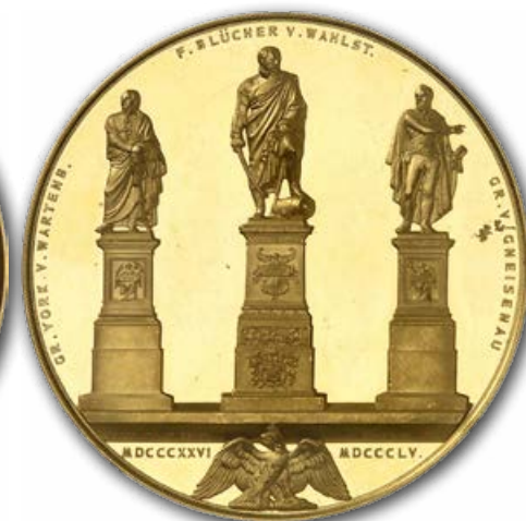
Abb. 10: Goldmedaille aus dem Jahr 1855 auf die Aufstellung von Denkmälern zu Ehren dreier bedeutender Feldherren der Kriege gegen Napoleon vor der Berliner Oper.

Honoratioren mit Medaillen beschenkt wurden – je nach Rang in unterschiedlichen Metallen.