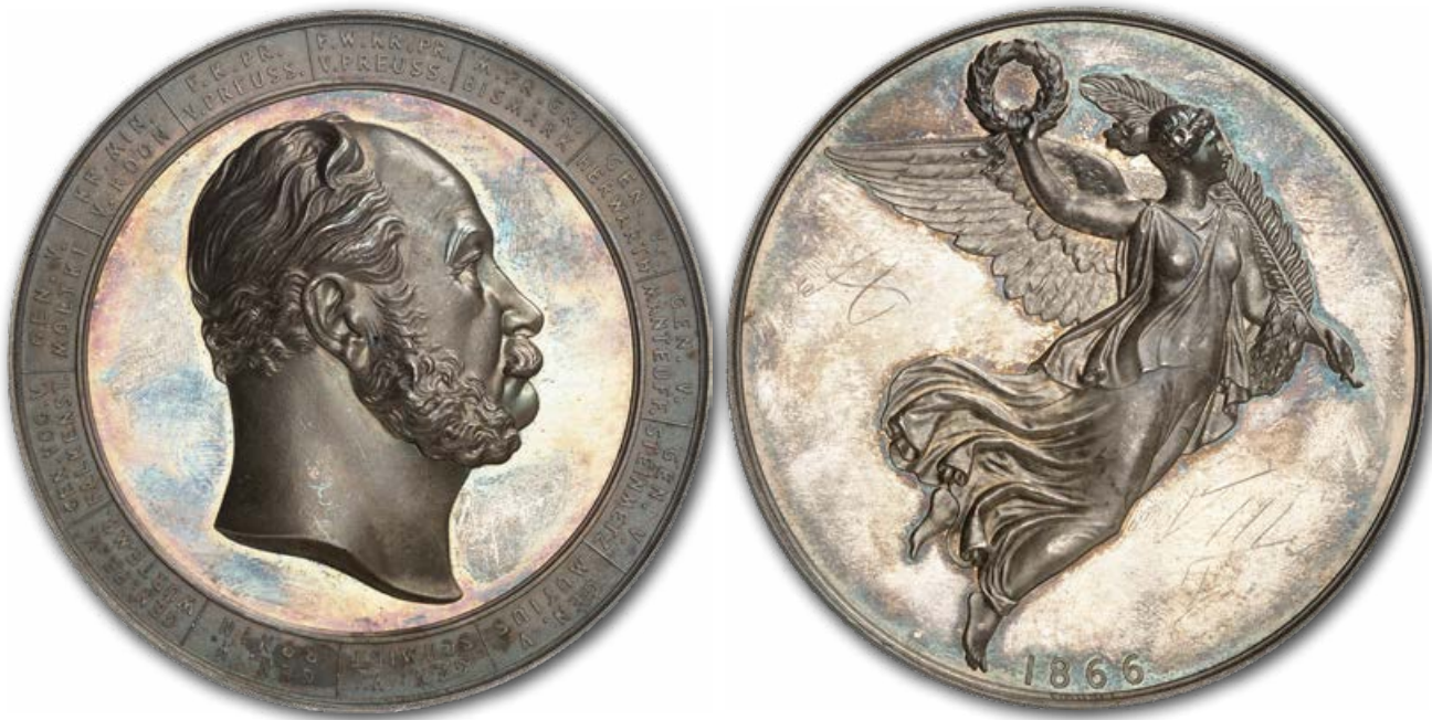
Abb. 14: Nur 100 Stück wurden 1866 von der silbernen Version dieser Medaille geprägt, die den preußischen Sieg über Österreich feiert. Dieser Sieg entschied die Frage, ob die Hohenzollern oder die Habsburger in Zukunft die führende Macht in Deutschland sein würden. Auf der Vorderseite sind die Namen der 13 preußischen Generäle genannt, die in diesen Krieg involviert waren.

Ernennung eine Reihe von kurzen Kriegen, die Preußen an die Spitze der deutschen Staaten katapultierten und die Einigung Deutschlands vollendeten.