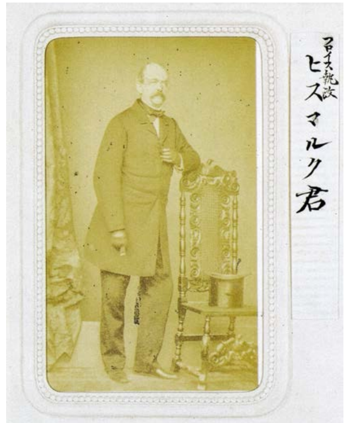
Abb. 19: Foto von Bismarck aus der Sammlung Kido Takayoshi. Veröffentlicht in Kasumi Kaikan (Hrsg.): Uchinaru kaikoku („Innere Öffnung des Landes“), 1993

Zentral wurde für Japan das deutsche Militärwesen. Hatte man vor der Rückkehr der Iwakura-Mission geplant, die französische Armee nachzubauen, orientierten sich die japanischen Generäle nun am deutschen Heer.