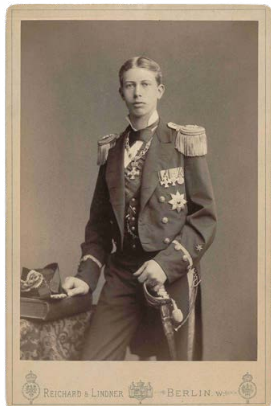
Abb. 4: Leutnant zur See Prinz Heinrich von Preußen, Photographie von 1881.

Das ausgeprägte persönliche Interesse Prinz Heinrichs an der japanischen Kultur und Geschichte trug wesentlich zur Intensivierung der deutsch-japanischen Beziehungen in der Zeit zwischen etwa 1880 und 1914 bei.