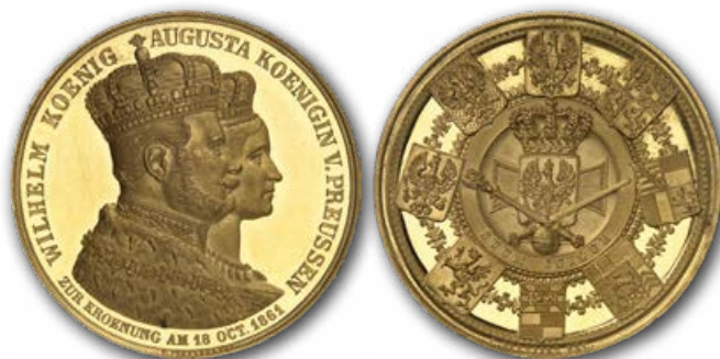
Abb. 3: Offizielle Medaille zur Krönung Wilhelms I. zum preußischen König am 18. Oktober 1861. Er und seine Frau sind im Krönungsornat dargestellt. Man beachte den Kragen mit Eichenlaub unter Wilhelms königlichem Hermelinmantel: Er trägt selbst bei seiner Krönung Uniform und betont so seine enge Bindung an das preußische Militär.

Abb. 2: Empfang der Takenouchi-Mission im Weißen Saal des Berliner Schlosses durch den preußischen König. Illustration aus der Berliner Illustrierten Zeitung vom 9. August 1862.