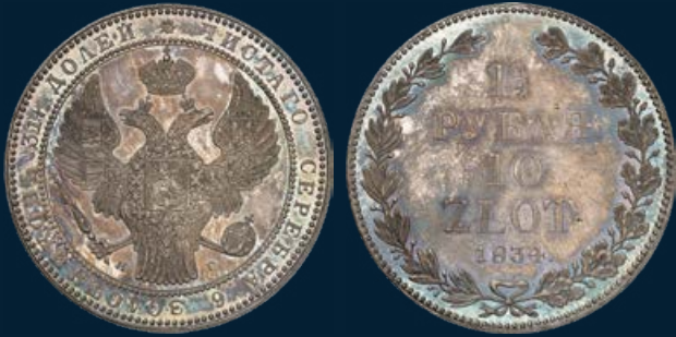
Kaiserreich Russland Nikolaus I., 1825-1855. 1 ½ Rubel (10 Zlotych) 1834, St. Petersburg, für Polen. Äußerst selten in dieser Erhaltung. Herrliche Patina, polierte Platte.

KÜNKER-AUKTION 442 AM 23. JUNI 2026 IN OSNABRÜCK