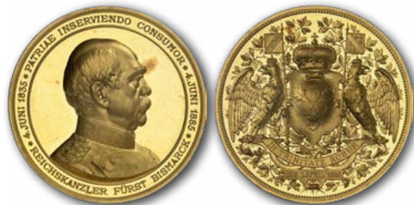
Abb. 13: Medaille auf den Reichskanzler Fürst Bismarck aus dem Jahr 1885 anlässlich Bismarcks 70. Geburtstag und 50. Dienstjubiläum.

Der alternde und politisch eher weniger begabte Wilhelm I. hatte immer mehr Mühe, die Delegierten des Landtages für seine politischen Plänen zu gewinnen. Er brauchte einen Vollblutpolitiker, der an seiner Stelle überzeugen, Allianzen schmieden und Mehrheiten organisieren konnte. So machte er im September 1862 den damals 47-jährigen Otto von Bismarck zum preußischen Ministerpräsidenten. Bismarck teilte die extrem konservativen Ideale Wilhelms und war unter Liberalen gefürchtet wegen seiner Bereitschaft, Konflikte militärisch zu lösen. Tatsächlich folgten seiner