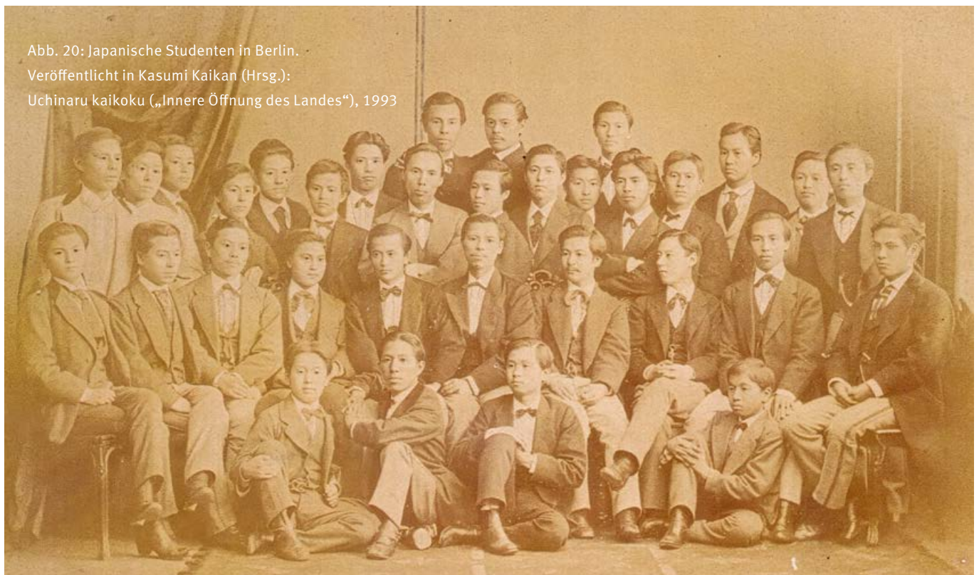
Abb. 20: Japanische Studenten in Berlin. Veröffentlicht in Kasumi Kaikan (Hrsg.): Uchinaru kaikoku („Innere Öffnung des Landes“), 1993