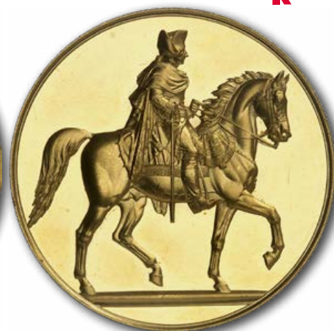
Abb. 9: Goldmedaille auf die Enthüllung des von Friedrich Wilhelm IV. geförderten Standbilds Friedrichs II. Es dürfte sich um das Exemplar Friedrich Wilhelms IV. oder seines Bruders Wilhelms I. handeln.