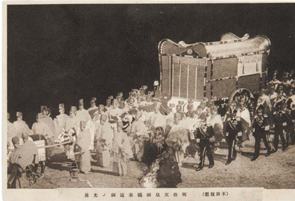
Abb. 7: Der Katabalk des Meiji-tennō, Postkarte von 1912.